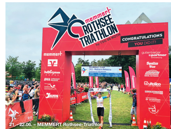
21. - 22.06. - MEMMERT Rothsee-Triathlon

Der weltgrößte Triathlon über 3,8 km Schwimmen, 180 km Radfahren und 42,2 km Laufen ist Roths Sport-Event des Jahres. Großes Festival-Pro- gramm für die ganze Familie inklusive Messe und Foodcourt. Hauptwettkampf: So 6. Juli