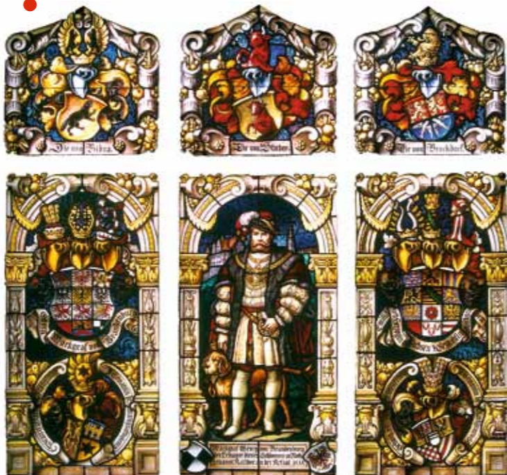
Das Glasfenster im Treppenhaus des Schlosses