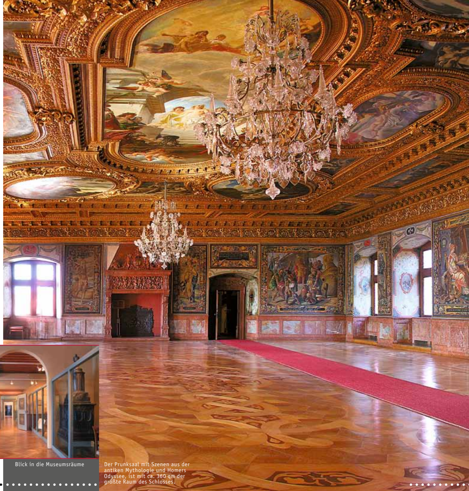
Der Prunksaal mit Szenen aus der antiken Mythologie und Homers Odyssee, ist mit ca. 360 qm der größte Raum des Schlosses.