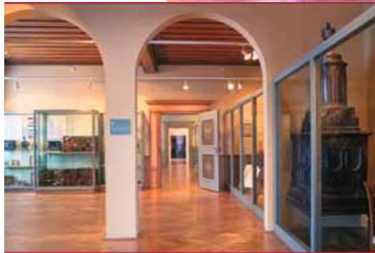
Blick in die Museumsräume

Im letzten Raum sind hauptsächlich Einrichtungsgegenstände aus der ehemaligen Schlossausstattung aufgestellt. Sie verbinden das Museum mit den historischen Räumen des ersten Stockes, durch die der Weg nun wieder zurück führt.