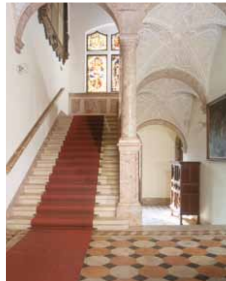
Treppenhaus des Schlosses

Vom idyllischen Schlosshof aus betritt man durch ein Sandsteinportal an der Südseite das prunkvolle Treppenhaus . Es erinnert an italienische Paläste der Renaissance. Das Glasfenster zeigt den Bauherren Markgraf Georg den Frommen umgeben von seinem und den Wappen seiner drei Ehefrauen. Darüber die Wappen der Familie Stieber und ihrer Verwandten. Das Treppenhaus mündet in die Repräsentativräume. Rechts öffnet sich das Kaminzimmer mit einer Kassettendecke und Mobiliar im Stil der Renaissance. Hinter einer reich verzierten Tür befinden sich das sog. Musikzimmer im klassizistischen Stil und das Barockzimmer mit originalen Wandbildern aus der 2. Hälfte des 18. Jahrhunderts.