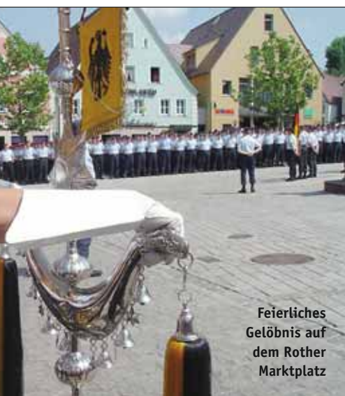
Feierliches Gelöbnis auf dem Rother Marktplatz

Besonders erwähnenswert ist die hervorragende Zusammenarbeit zwischen Bürgern und Soldaten, die sich zu einem herzlichen Verhältnis des gegenseitigen Respekts und Miteinanders entwickelt hat.