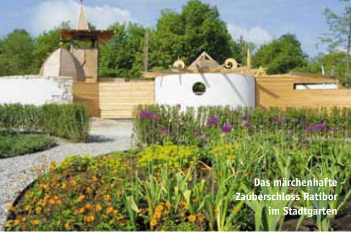
Das märchenhafte Zauberschloss Ratibor im Stadtgarten