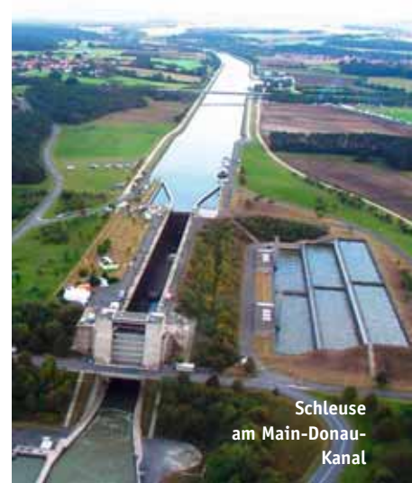
Schleuse am Main-Donau-Kanal

die Bundesautobahnen A6 und A9, ein interessanter Firmen- und Branchenmix aus großen und weltweit agierenden modernen Unternehmen, mittelständischen Betrieben und Kleinunternehmen, eingebettet in das Fränkische Seenland, kombiniert mit hohem Freizeitwert der Region und einem abwechslungsreichen Kulturprogramm, das für die Erholung von der Arbeit sorgt – so könnte man die wichtigsten Vorteile des Standortes Roth für Unternehmer und Arbeitnehmer in wenigen Zeilen beschreiben.