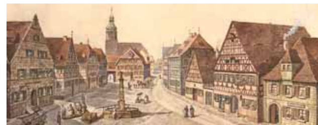
Marktplatz, Friedrich Trost, 1913

Roth wird anlässlich der Weihe einer Kirche durch Bischof Gundekar II. erstmals urkundlich im Jahr 1060 erwähnt. Der Marktplatz entstand im 12. Jahrhundert im Zuge einer planmäßigen Marktgründung. Seit Mitte des 14. Jahrhunderts besitzt Roth Stadtrechte.