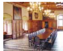
Speisesaal Schloss Ratibor

Lange bevor Roth im wirtschaftlichen Leben eine Rolle zu spielen begann, war der Ort bereits als ein von Kaiser und Reich anerkanntes Asyl weit über die Grenzen Frankens hinaus bekannt. Hier fanden alle diejenigen Zuflucht, die unbeabsichtigterweise mit dem geltenden Recht in Konflikt geraten waren.