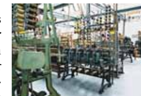
Fabrikmuseum der Leonischen Industrie

Nach der Abdankung des letzten Markgrafen 1791 fällt das Fürstentum unter preußische Verwaltung. 1806 wird es dem neuen Königreich Bayern einverleibt.