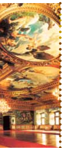
Prunksaal im Schloss Ratibor

Sehr geehrte Gäste, liebe Bürgerinnen und Bürger