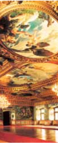
Prunksaal im Schloss Ratibor