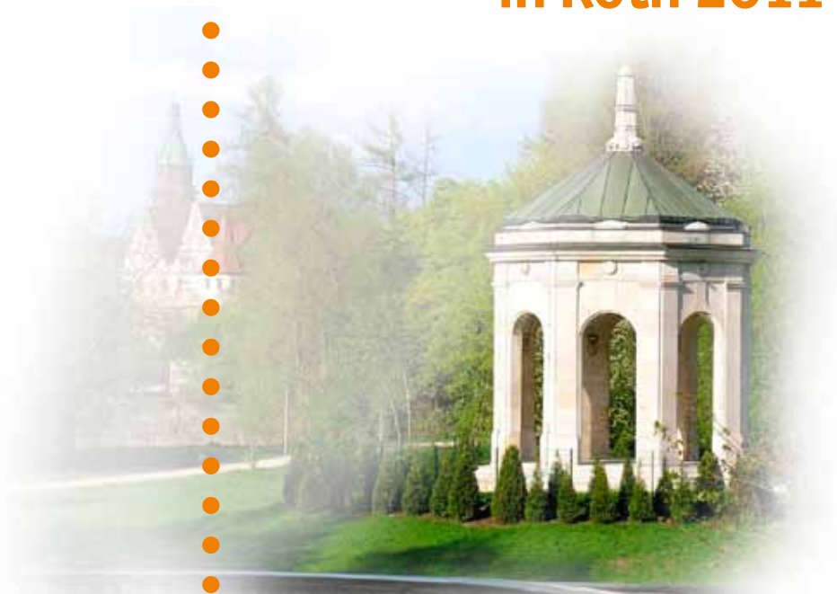
Oliver Frank Kommunikationsdesign